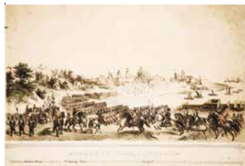
Ataque por los ingleses a Buenos Aires. Reconquistada Buenos Aires por el capitán de navío D. Santiago Liniers, haciendo prisionera a la guarnición inglesa con su comandante Beresford. Vuelve la escuadra británica en 1807 a atacar con empeño la misma plaza y es rechazada por el valor de nuestros marinos y soldados. Obra de Vicente Urrabieta y Ortíz. Ejemplar conservado en el Museo de la Casa Rosada.

José Sellés-Martínez INSTITUTO DE INVESTIGACIONES HISTÓRICAS DE LA MANZANA DE LAS LUCES