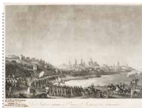
Los ingleses atacan a Buenos Aires y son rechazados. 1807. Obra firmada por José Cardano abajo a la derecha. Ejemplar conservado en el Museo Saavedra.

de la anterior, ya que en el costado derecho aparece una construcción que no está presente en la obra de Cardano y parecería referirse también al desembarco de las tropas inglesas, ya que esa es la acción que describe la primera parte del largo título.