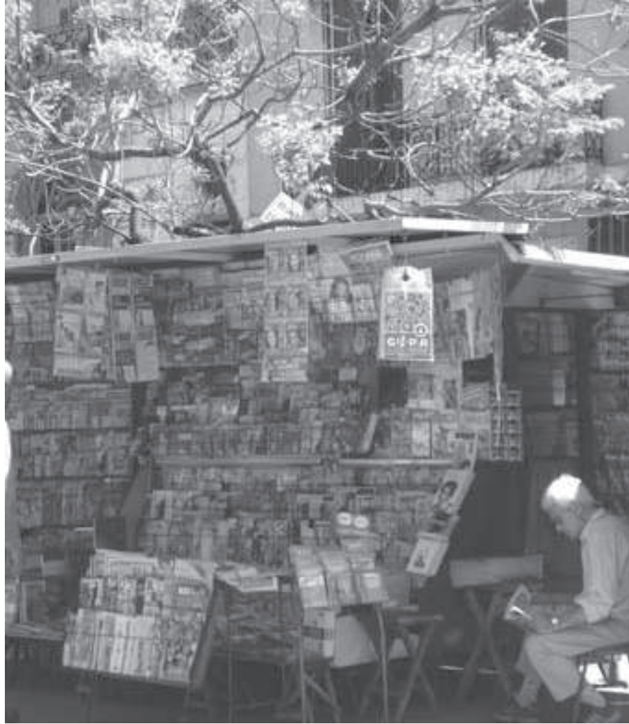
Un kiosco de diarios del barrio.

Con El Sol de San Telmo y el periodismo comunitario queremos revalorar el intercambio y la conexión humana a través de un periódico cuya identidad, contenido, y espíritu se define a través de la participación