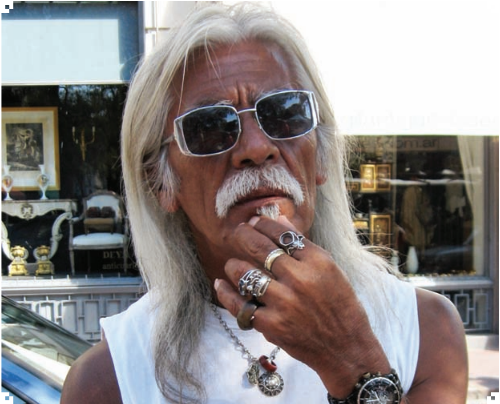
“El gaucho de la Plaza Dorrego”

Dicen que una imagen vale 1.000 palabras. En nuestra contratapa exponemos una imagen del barrio, fotográfica o artística, que transmite algo esencial de San Telmo. ¡Los invitamos a contribuir!