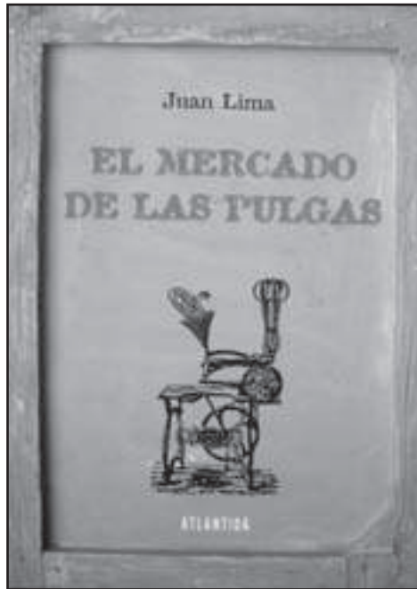
El Mercado de las Pulgas, disponible en la librería Fedro