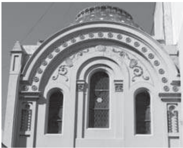
Arriba: la iglesia ortodoxa, frente al Parque Lezama Arriba: la sinagoga sefardí de la calle Piedras