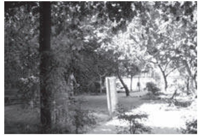
La plazoleta hoy

ta las tapitas de agua que faltan y las farolas que no prenden (tiene decenas de estos cuadernos en su casa); y documenta todo con su cámara de fotos para acompañar a las denuncias que manda regularmente al GCBA.