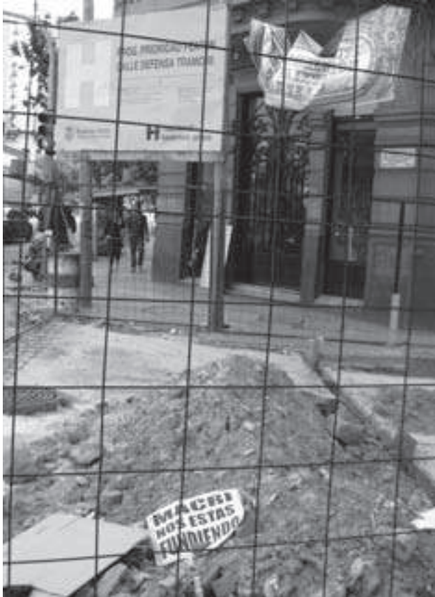
La calle Defensa entre Independencia y Chile: una de las cuadras más traficadas del barrio quedó cercada durante las fiestas

Este último ha sido un proceso problemático por una serie de atrasos incluyendo la perforación de un caño de gas, el descubrimiento de hue-