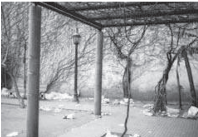
La plazoleta hace tres años

"Preguntamos al CGP1 si había algún problema en que la cuidáramos a nuestro costo, y ellos cambiaron los parantes de las rejas absolutamente carcomidas por el orín de los perros y las pintaron. Luego pinta-