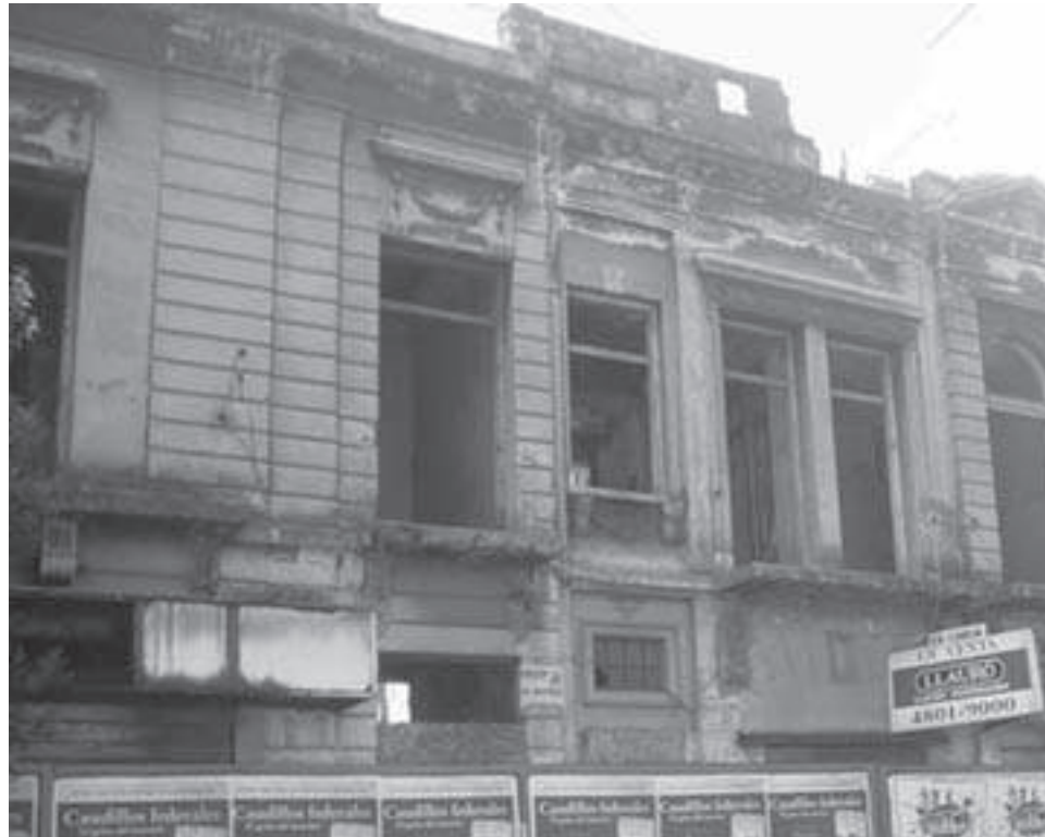
Un edificio no-protegido y casi arruinado sobre la calle Brasil, ahora en venta