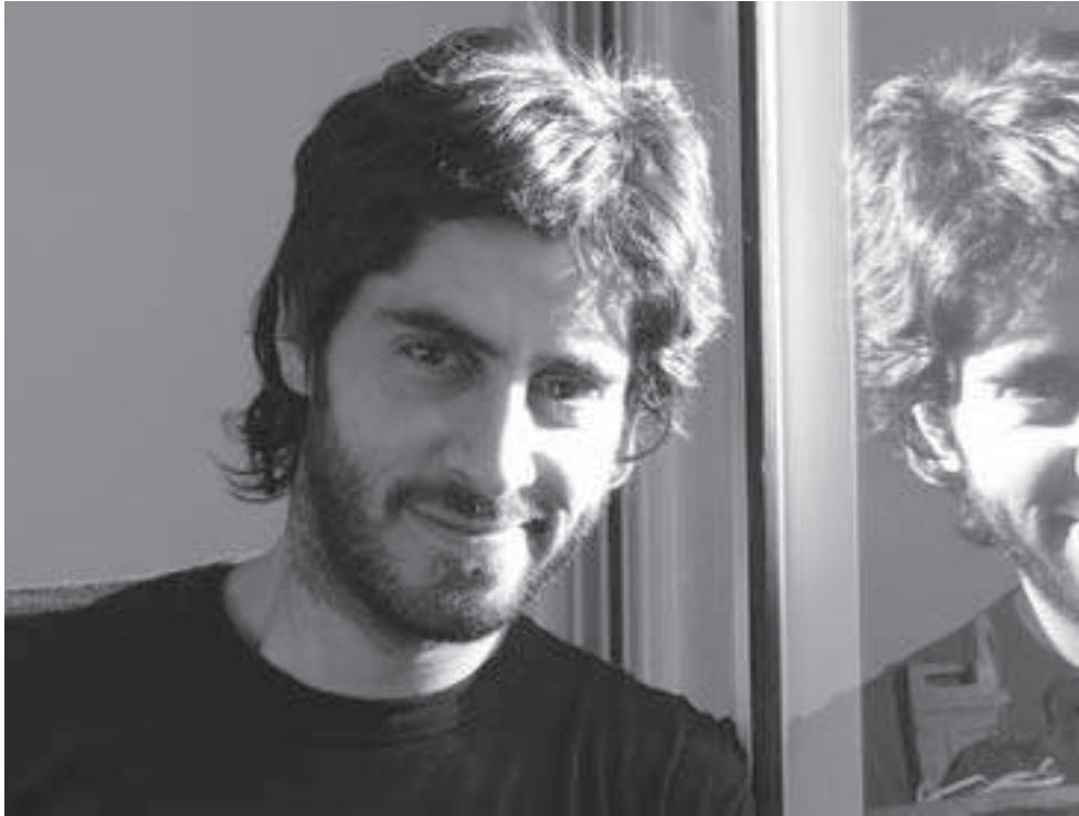
Arriba: Tute. Abajo: Los dos Sures de la tira cómica "Batu"

Los humoristas gráficos tienen el privilegio de ser un puente entre el mundo imaginario de la adultez y el de la niñez. Y San Telmo tiene el privilegio de compartir la historia gráfica argentina con algunos de sus creadores más queridos: Quino, Caloi y más recientemente, Tute.