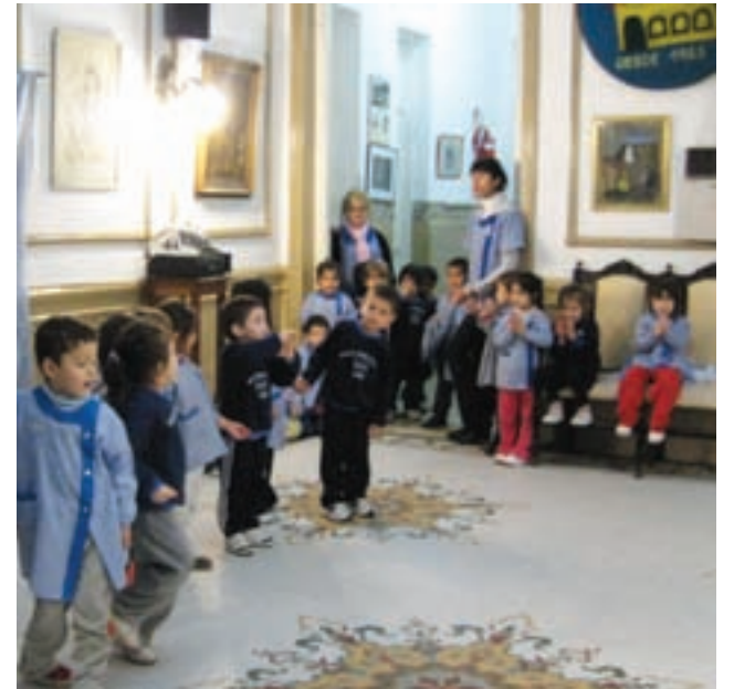
Izquierda a derecha: bailando en el Centro de Jubilados Nuevos Horizontes de San Telmo, un chico juega solo en el Parque Lezama, alumnos del Instituto Integral del Sud.

ilusión, una esperanza, lo que el chico recibe de la televisión es lo más nefasto de la sociedad. El niño de hoy cambió el juego, el campo y la naturaleza por la pantalla”.