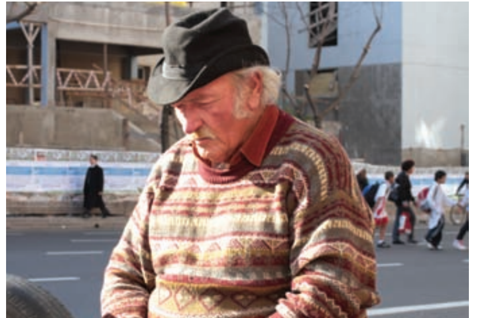
Izquierda: alumnos del Instituto Integral del Sud. Derecha: jugando ajedrez en la vereda de la Avenida Independencia

Hoy San Telmo es celebrado por ser un nuevo polo de cultura, turismo y comercio de Buenos Aires. Algunos lo ven con entusiasmo y otros no, pero el Casco Histórico está cada vez más posicionado como una zona cosmopolita de residentes nuevos, y no como el barrio de familias trabajadoras que era hace diez o más años atrás.