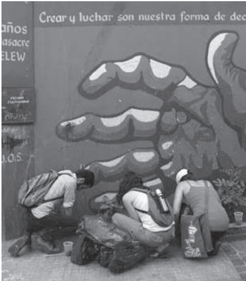
Arriba: sembrando en la Plaza Rodolfo Walsh.

Para más información sobre Articultores (próximas intervenciones, técnicas de cultivo urbano y fabricación de bolas de semillas):