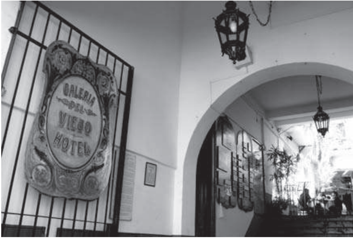
La encantadora entrada de la Galería del Viejo Hotel invita al residente tanto como al visitante