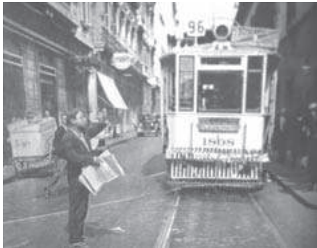
La línea 96 en la esquina de las calles Defensa y Alsina

A veces, los repartidores estacionaban sus carros encima de las vías y se rehusaban a desplazarlos antes de terminar sus tareas. Había protestas, insultos