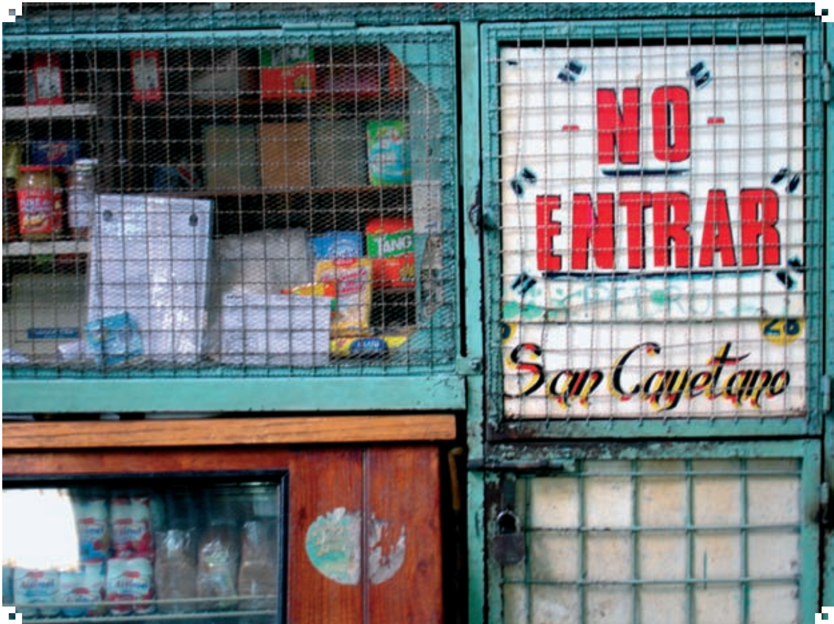
“Caprichos del hoy” (Mercado)

Dicen que una imagen vale 1.000 palabras. En nuestra contratapa exponemos una imagen del barrio, fotográfica o artística, que transmite algo esencial de San Telmo. ¡Los invitamos a contribuir!