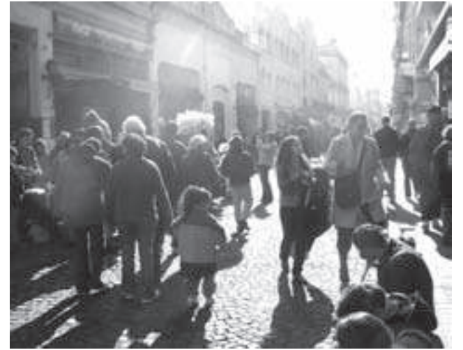
La calle Defensa cuando es peatonal los domingos