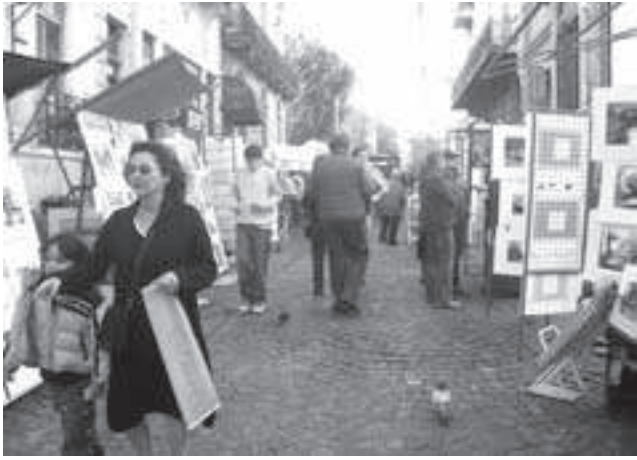
La Feria de las Artes en la calle Humberto Primo