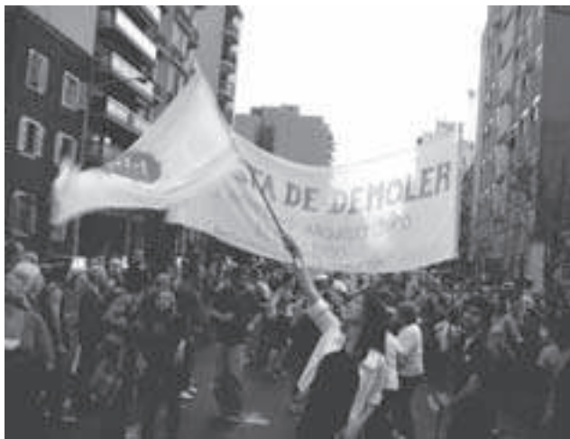
El acto del 18 de mayo por el edificio demolido

El boom inmobiliario que vive el barrio de San Telmo se llevó una casona del siglo XIX ubicada en la esquina de Independencia y Bolívar, que perteneció al ingeniero